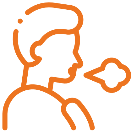
Dificultad de Respirar