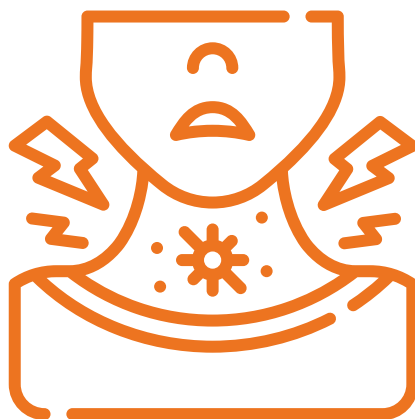
Dolor de Garganta